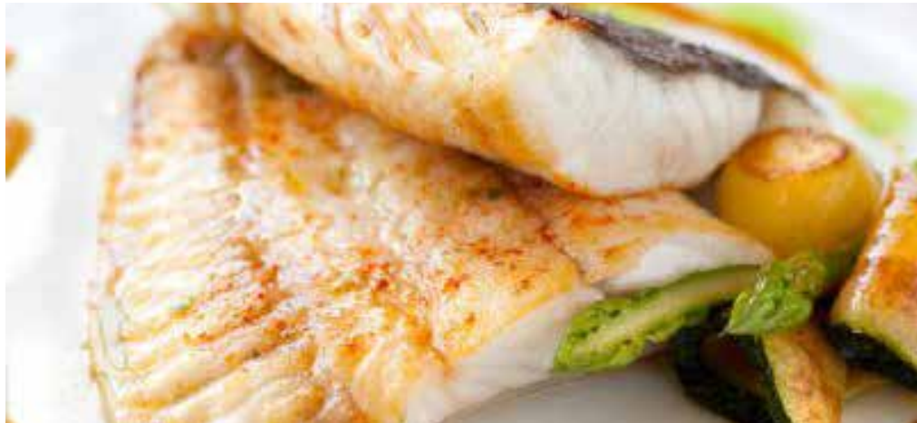
FILET DE TURBOT, GASPÉSIE