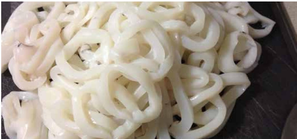
RONDELLES DE CALMARS NATURES, ASIE