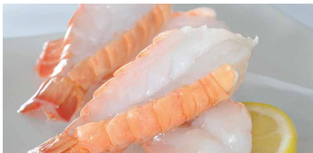
LANGOUSTINES COUPÉES ( 26/30 ), ASIE