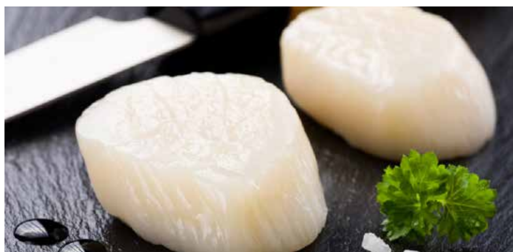
PÉTONCLES COUPE SAHIMI ( 60/80 ), PÉROU